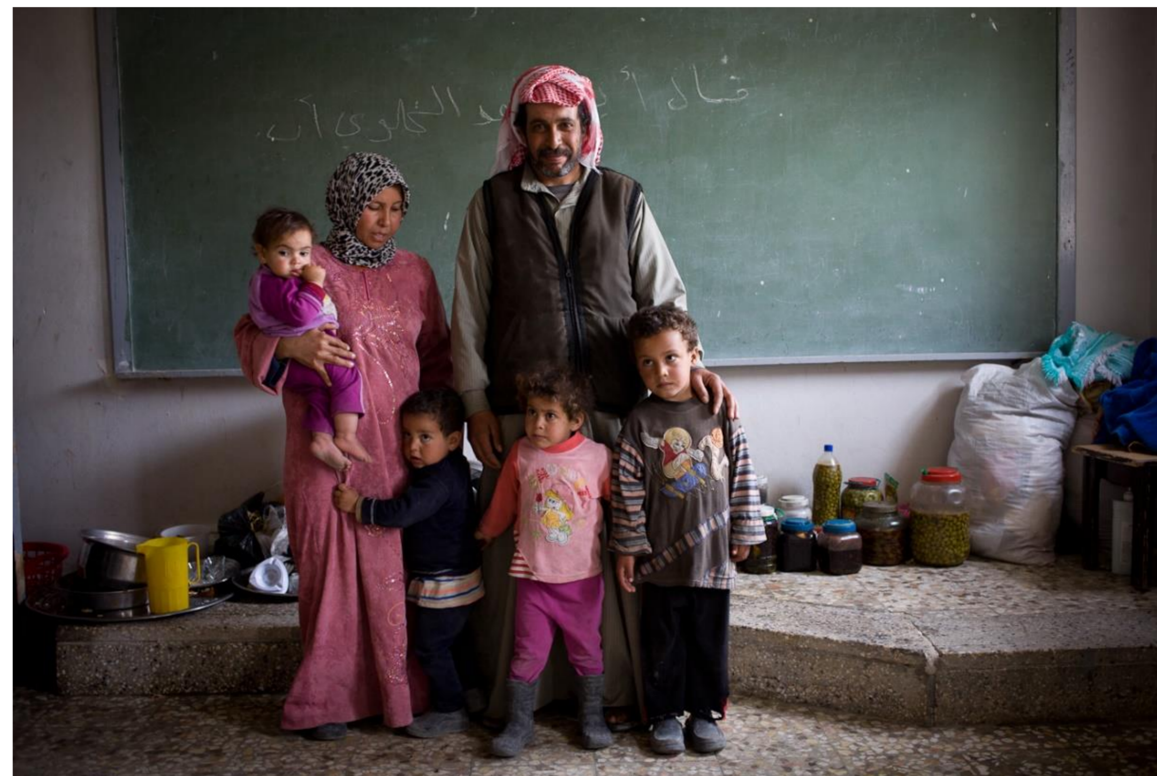
Syria, 2013.

Budujemy i remontujemy systemy wodociągowe i kanalizacyjne.