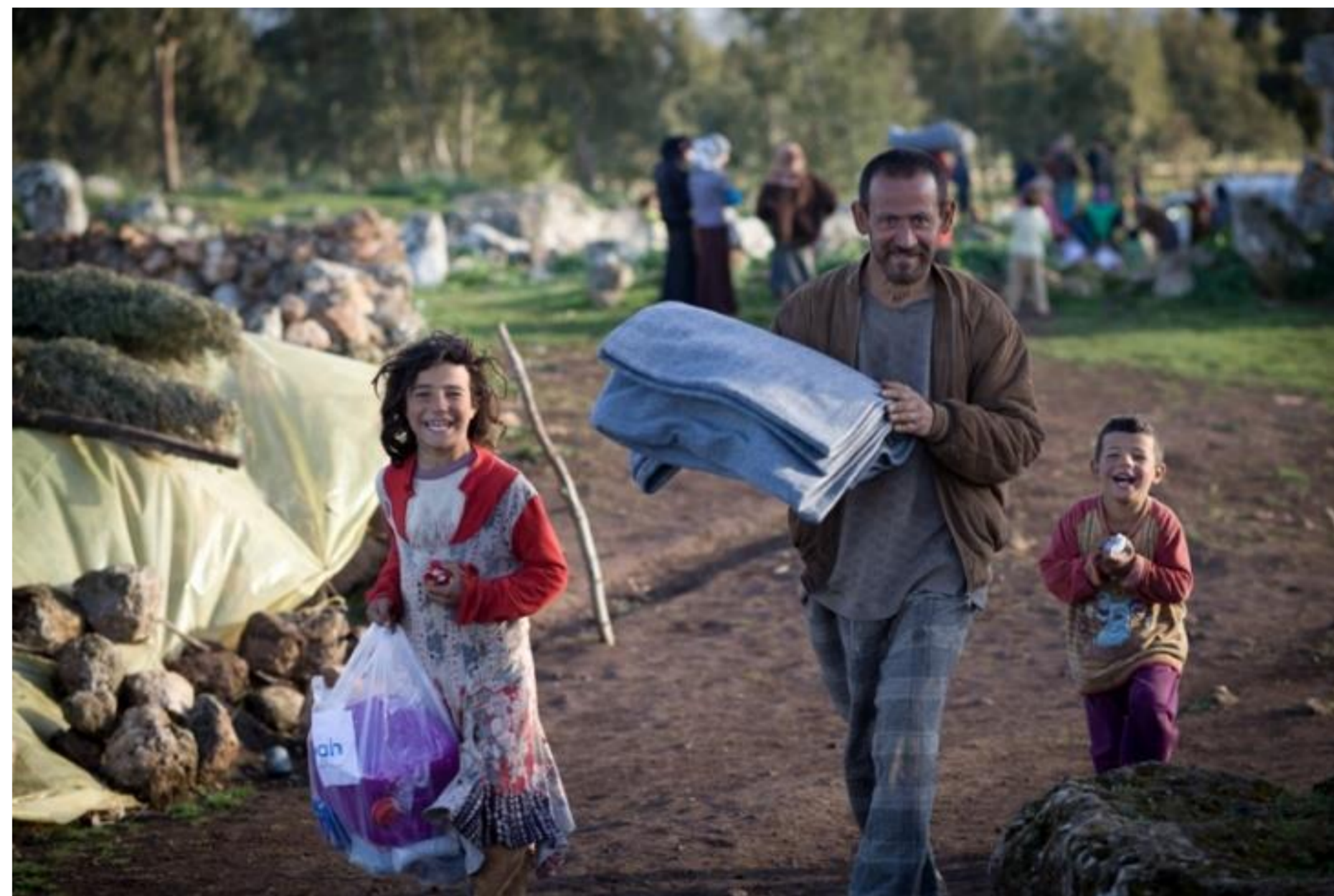
Syria, 2013.