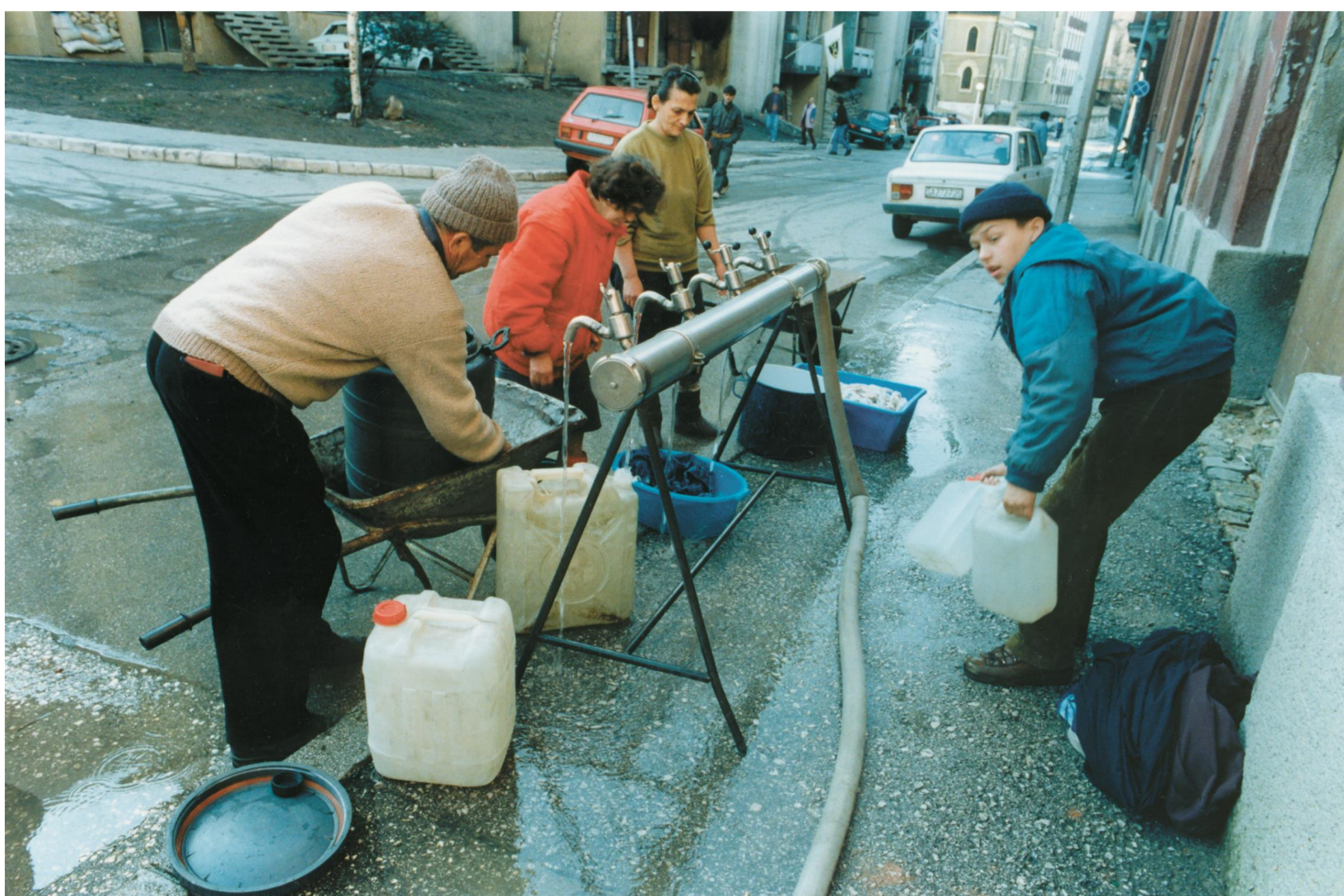
Czeczenia, Grozny, 1994.