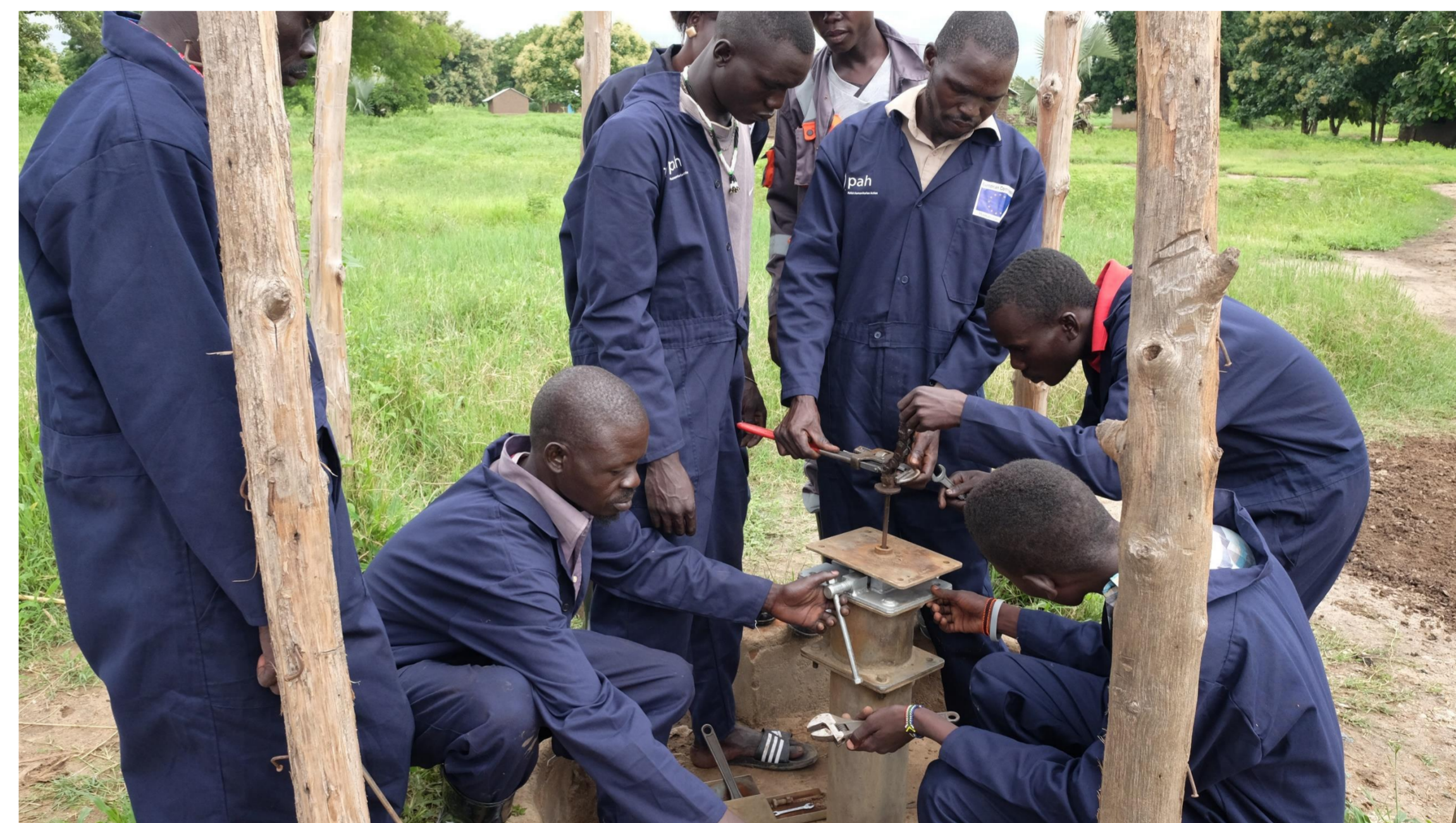
Szkolenie mechaników, Sudan Południowy 2017.

Szkolimy promotorów higieny, mechaników, inicjujemy działanie komitetów wodnych i szkolnych klubów promocji higieny.