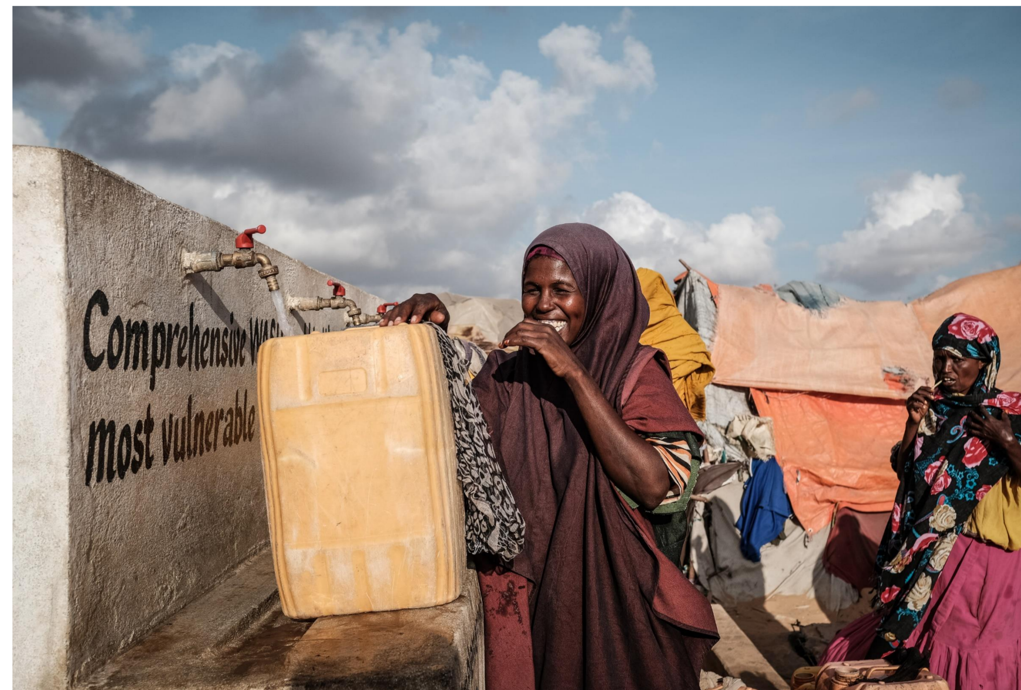
Somalia, 2017.