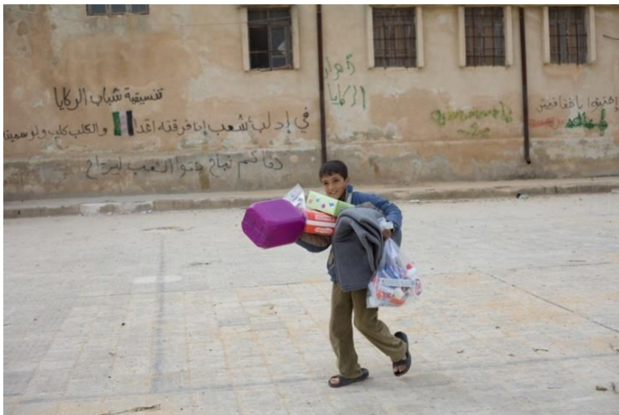
Syria, 2013.