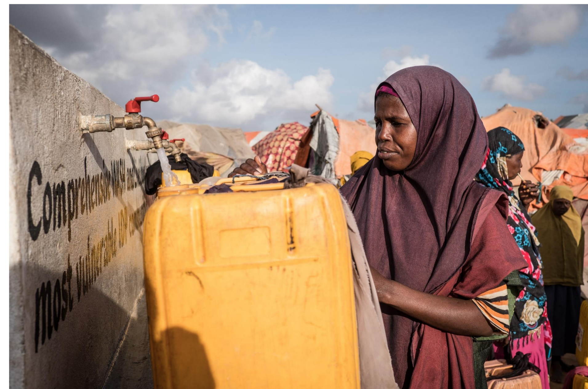
Somalia, 2017.

NIEZALEŻNOŚĆ nie dotyczą nas cele polityczne, ekonomiczne czy militarne.