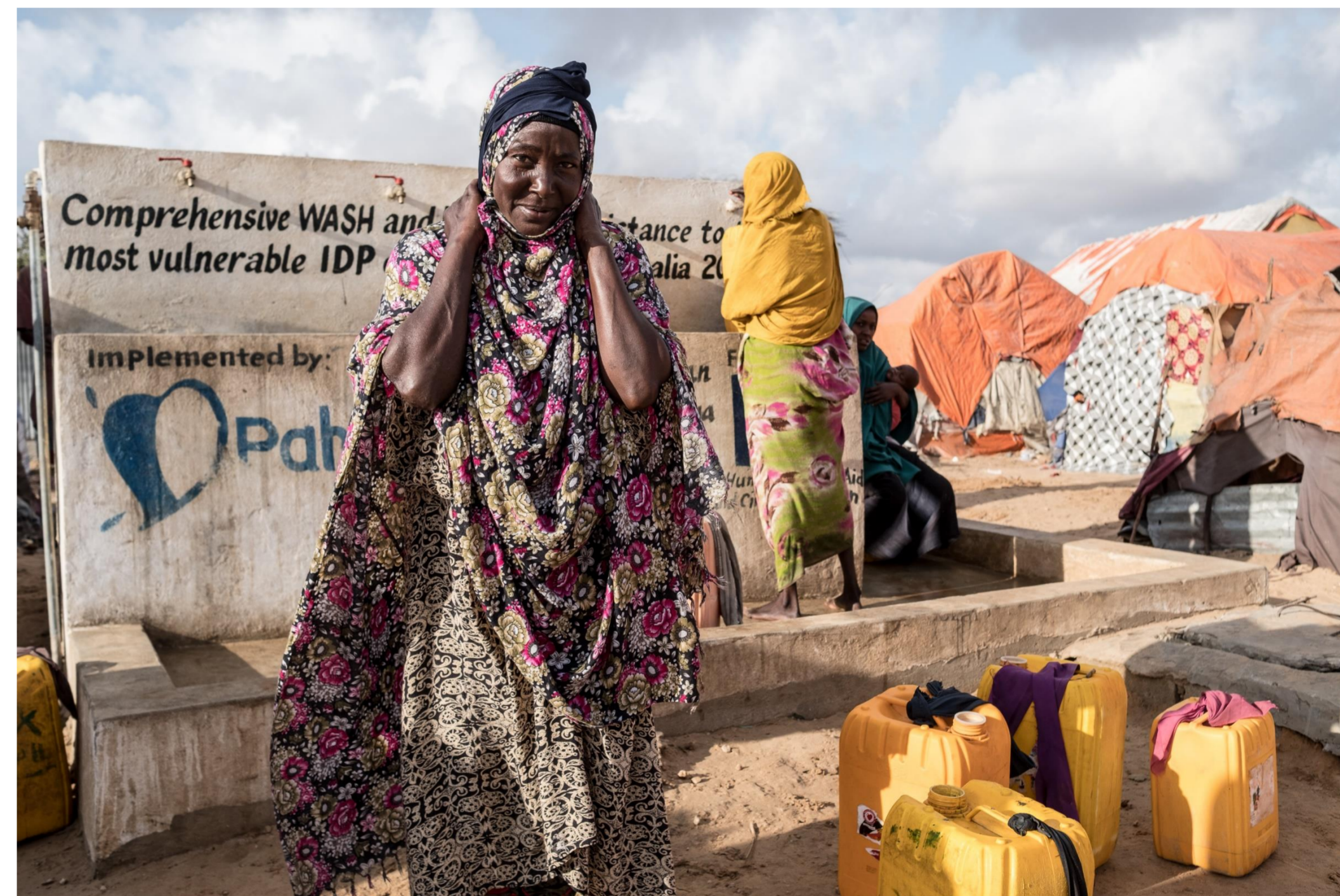
Somalia, 2017.

Naszą misją jest uczynić świat lepszym przez zmniejszanie cierpienia i promowanie wartości humanitarnych.