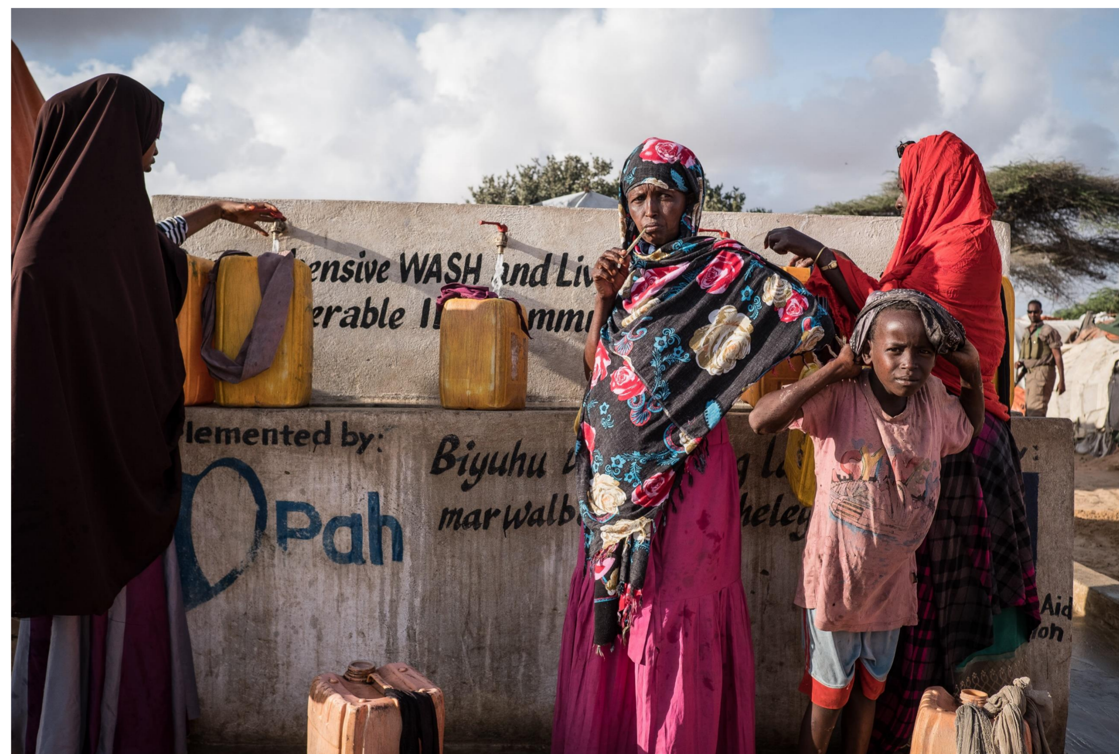
Somalia, 2017.