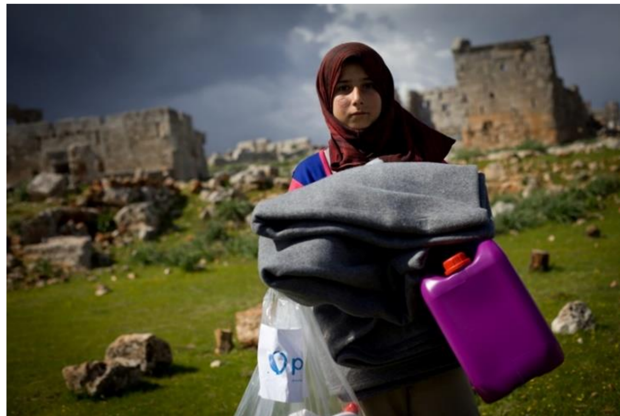
Syria, 2013.

TRANSPARENTNOŚĆ traktujemy priorytetowo.