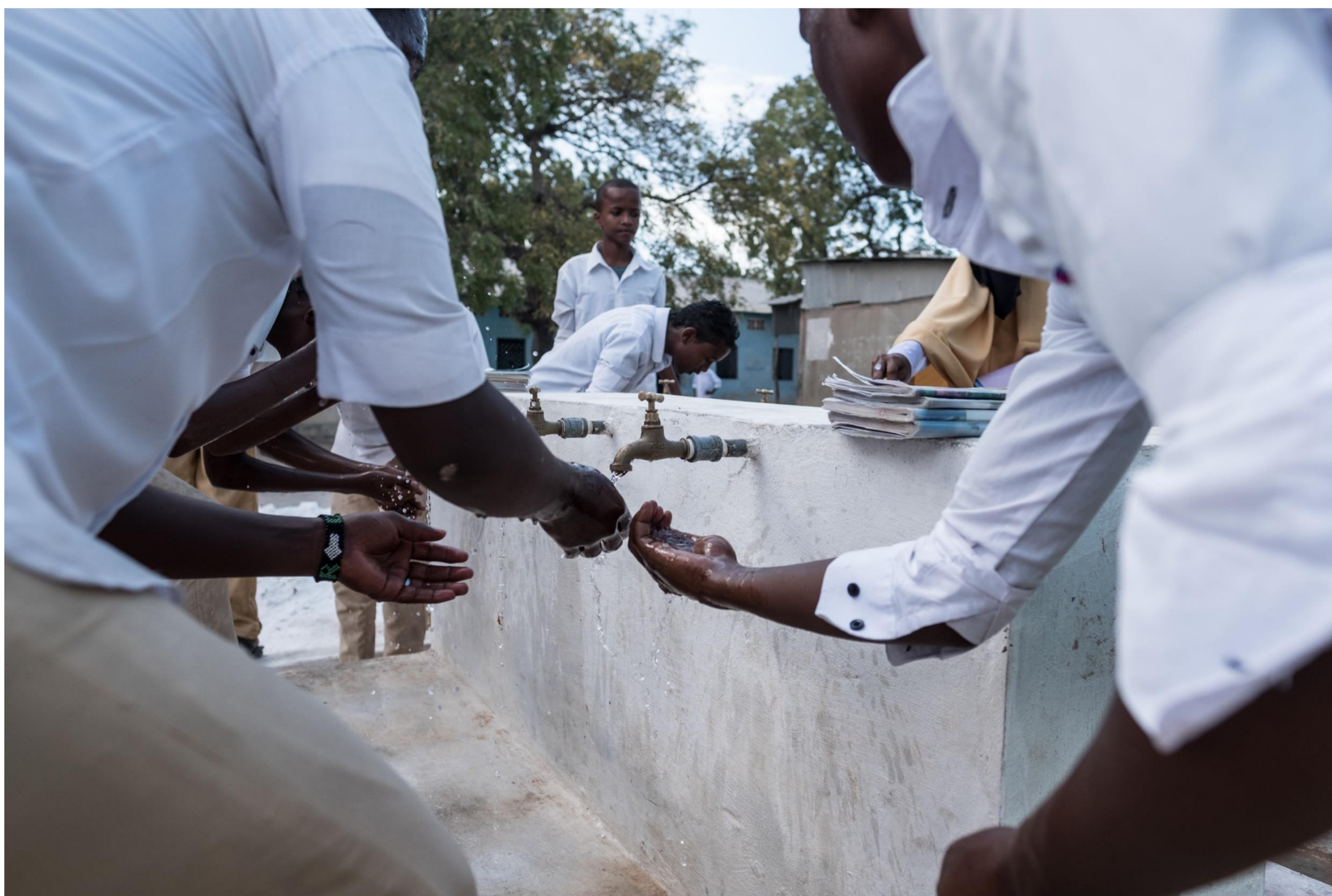
Somalia, 2017.