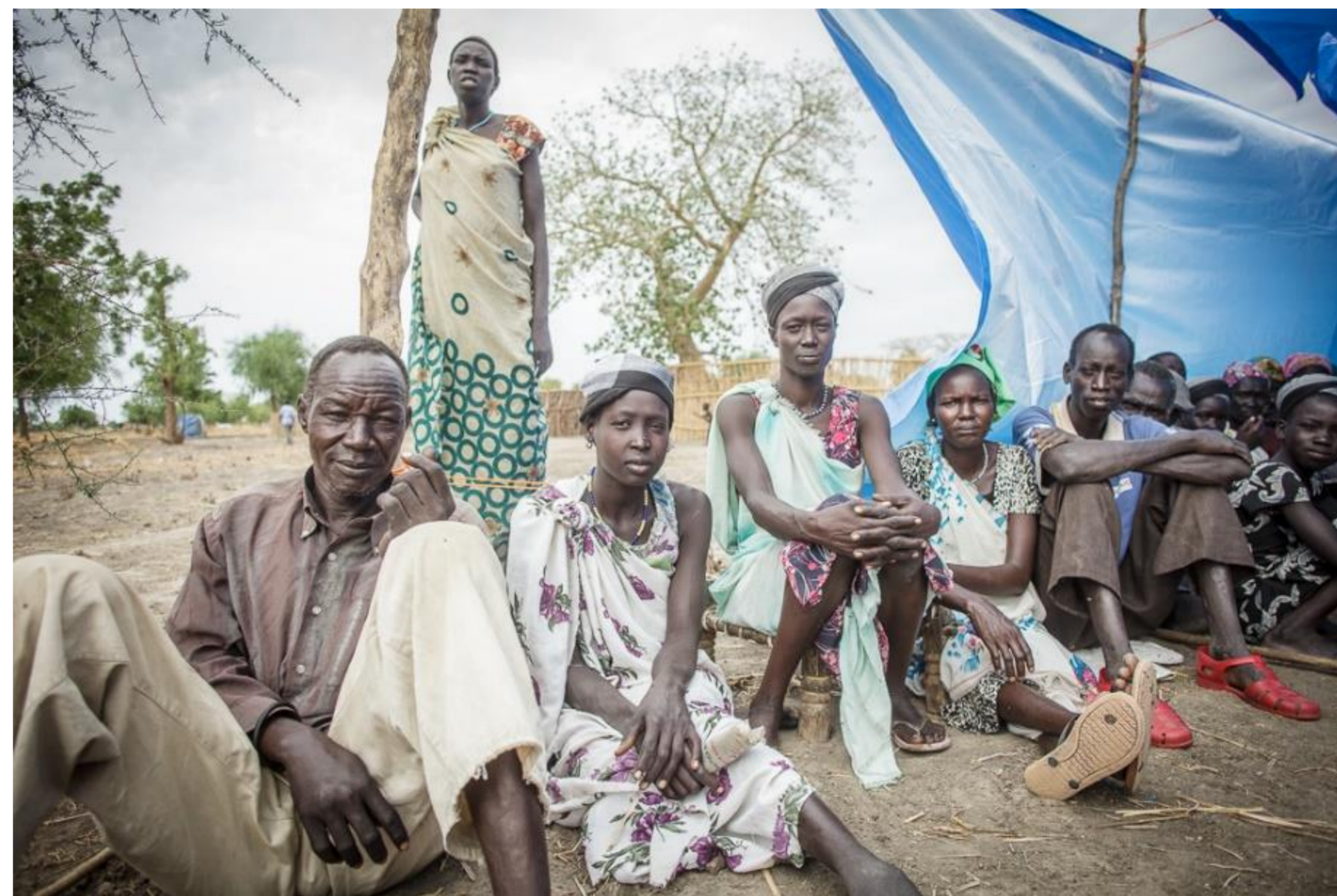
Sudan Południowy, 2015.