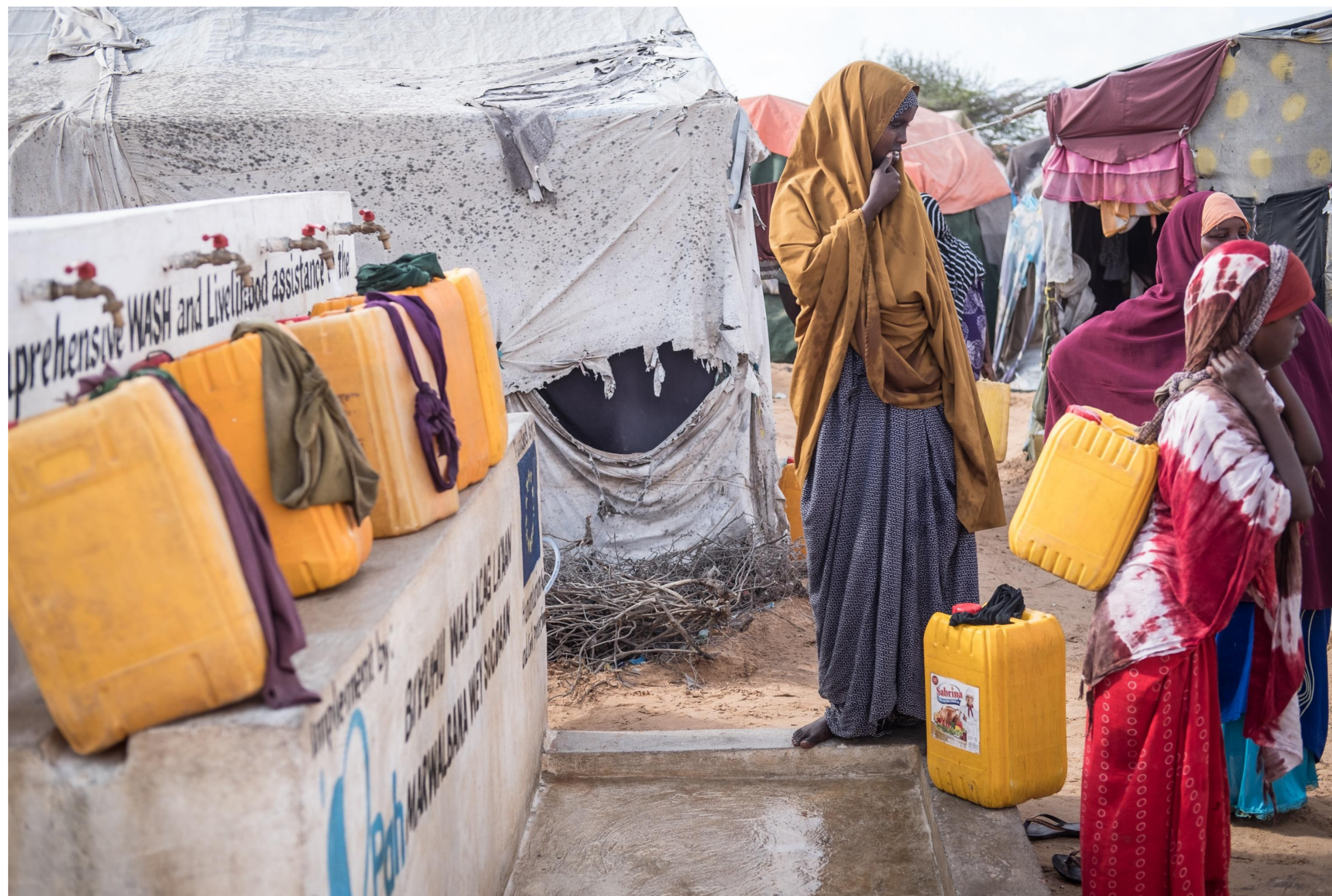
Somalia, 2017.