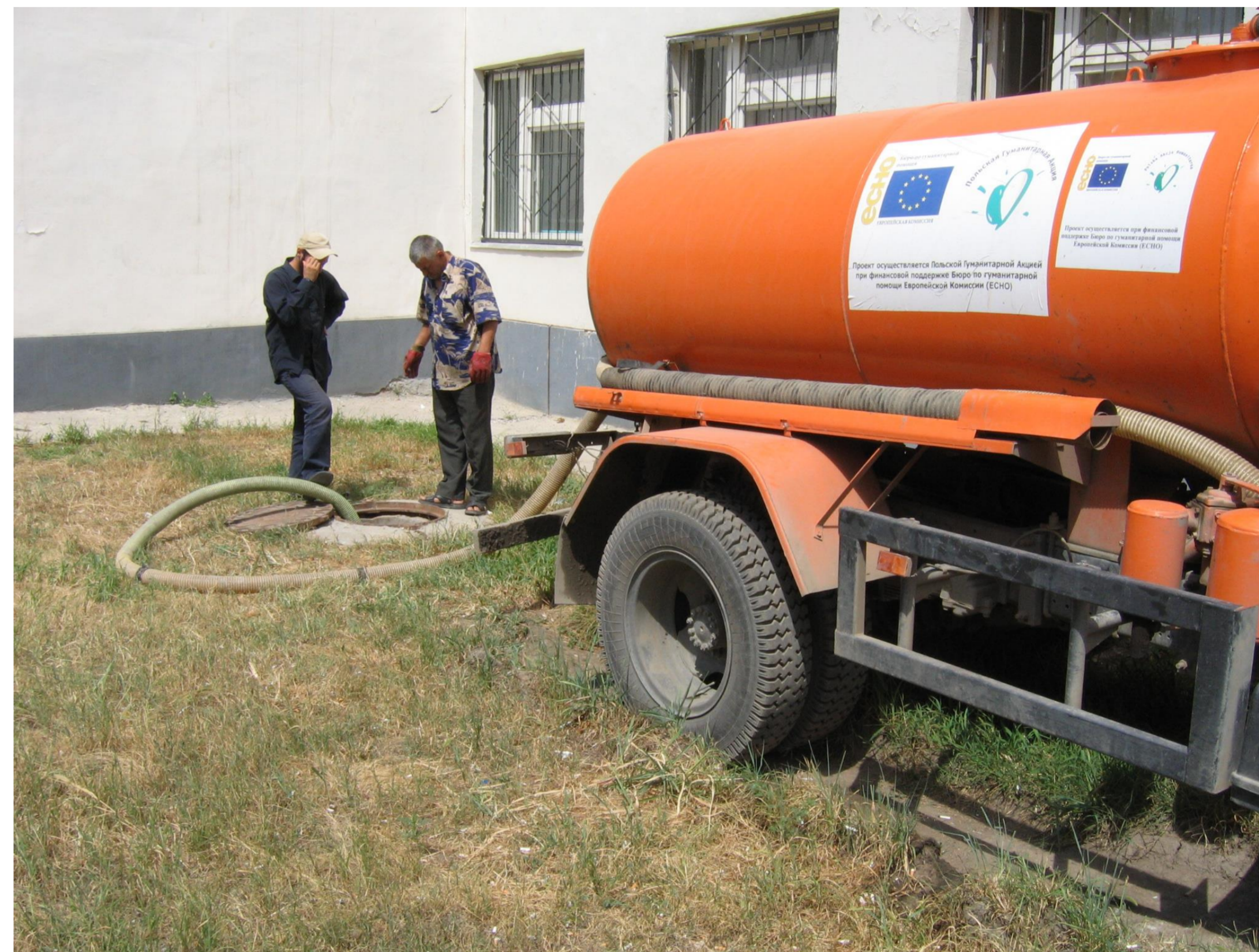
Czeczenia, Grozny, 2005.

Doświadczenie zdobyte w Groznym sprawiło, że zapewnianie dostępu do wody i bezpiecznych warunków sanitarnych (WASH) stało się kluczowym działaniem na kolejnych misjach PAH.